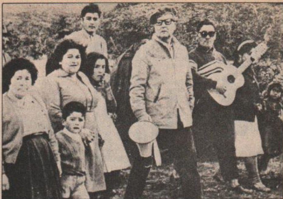
En una de sus tantas giras por el país. Le gustaba estar junto al pueblo.