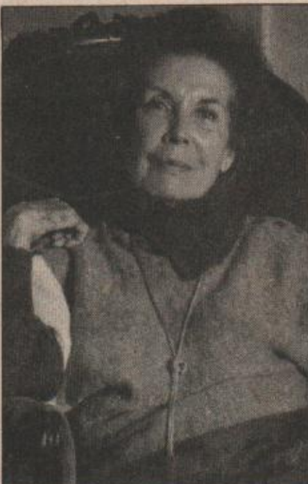
"Los ojos más lindos de Chile". Su esposa Hortensia Bussi.

Ese rasgo era una de las características más relevantes de la personalidad de Salvador Allende: asumir las situaciones difíciles y remontar con buen ánimo incluso las derrotas. Perseverante e inagotable en el trabajo, después de las campañas presidenciales del 52, el 58 y el 64, en las que salió derrotado, empezó a trabajar al día siguiente para la próxima ocasión. Su sentido del humor también se manifestaba en esas ocasiones, como recuerda Olga Corssen: "Al día siguiente de una de las elecciones, ya no me acuerdo cuál, salió de su casa de Guardia Vieja en su auto y había un grupo de niños jugando en la calle. Uno de los chicos de la pandilla paró el auto manejado por el Chicho y le dice: 'Dígame, doctor, ¿cómo en un auto tan chico puede sentarse con una cola tan larga?'. Después él se reía a gritos de la audacia del chiquillo". Manuel Mandujano se acuerda del día en que Allende asumió la Presidencia y subieron a La Moneda a