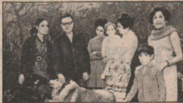
La familia reunida. Allende, su esposa, sus hijas y sus nietos.

Era pequeño cuando la familia se trasladó a vivir a Tacna, todavía en manos chilenas, y allí permanecieron hasta 1916. Algún tiempo en Iquique, luego Valdivia y en 1920 nuevamente Valpa-