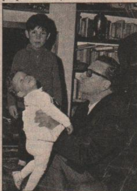
Le gustaba disfrutar a su familia. Aquí con dos de sus nietos.

Gran conversador, tenía el encanto que lo hacía atractivo a las mujeres, especialmente porque Allende siempre tenía la palabra justa para que todas —jóvenes o mayorcitas— se sintieran en las nubes. "No se trata de que fuera el piropero común y corriente. El era ele-