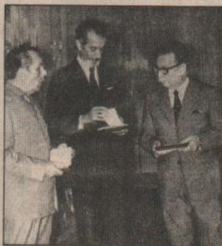
Allende junto a dos hombres en los que depositó su confianza en distintas etapas de su vida y que no le fallaron: el general Prats y José Tohá.